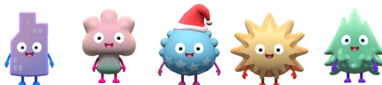
ミナモンイメージ