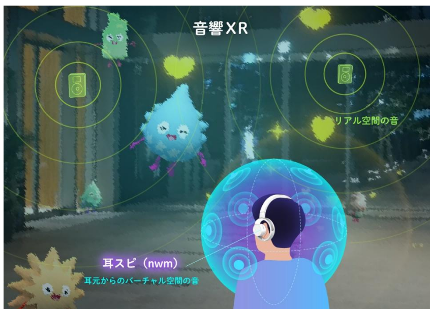
体験イメージ（「音響XR」およびミナモン登場シーン）

「音響XR」は、空間上の音源を仮想的に3次元的に配置して、現実の環境音とバーチャル空間の音とを自然に融合させるNTTグループの音響技術です。「音響XR」がデジタル上の仮想世界の演出に加わることで、参加者は、あたかもキャラクターが実際にそこに存在しているような、立体的な聴覚体験ができます。今回は、NTTソノリティが提供するオープンイヤー型オーバーヘッド耳スピーカー「nwm ONE（ヌームワン）」を用いた新たな演出として、会場のスピーカーから流れる環境音とヘッドホンから流れる音の演出のそれぞれが、耳をふさぐことなく融合する聴覚体験を、期間限定でお楽しみいただけます。