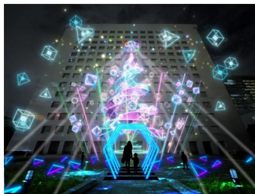
演出イメージ (NTT品川TWINS前広場)