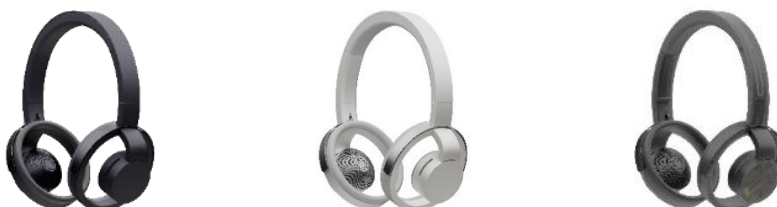
オープンイヤー型オーバーヘッド耳スピーカー「nwm ONE（ヌームワン）」